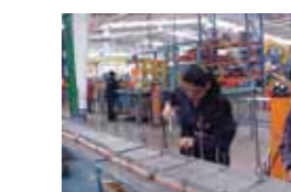
Carga con Nitrógeno