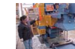
Troquelado de aleta