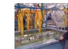
Prueba de fugas

BOHN, cuenta con la más amplia gama de serpentines, utilizados en los mercados industriales, comerciales, aire acondicionado, transportación y de reemplazo.