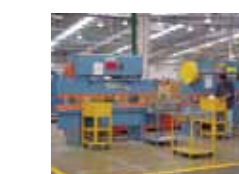
Dobladoras de Cabeceras